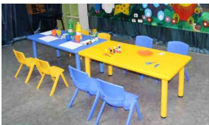
兒童枱 及 兒童椅