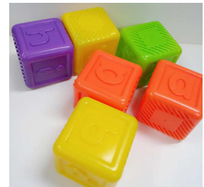
塑膠英文字母立 方體