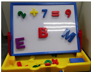
磁石英文字母及數字