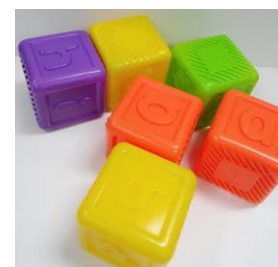
塑膠英文字母立方體