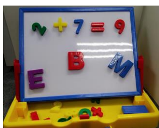
磁石英文字母及數字